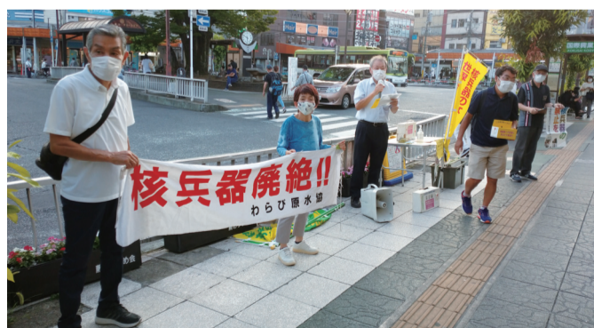
毎月、蕨駅前前で核兵器廃絶を訴えている市民団体の皆さん(2020年8月6日) 日本共産党市議団も毎回参加