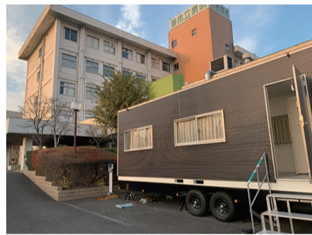
発熱者専用の待合室(右)が整備された市立病院

重点要望は「新型コロナウイルスから市民の命と暮らし・営業を守る」「市民の願いを生かし、安全・安心のまちづくり」「市民の暮らしと福祉を最優先した行政を」など6つのテーマで構成。新型コロナ対策では、厳しい財政状況でも暮らしを支える立場を堅持すること、検査・医療体制の充実、市立病院の積極的な対応など求めています。